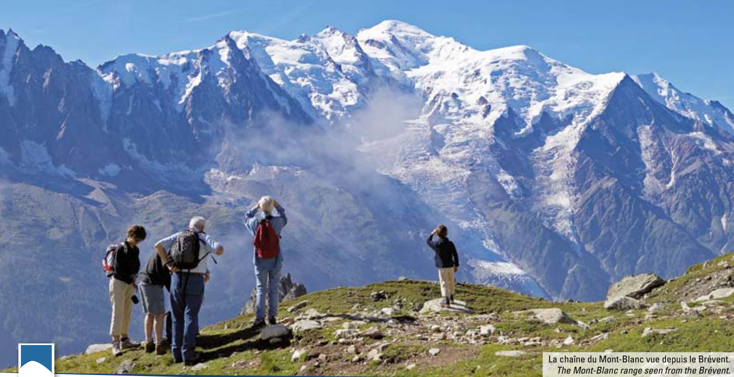
La chaîne du Mont-Blanc vue depuis le Brévent. The Mont-Blanc range seen from the Brévent.