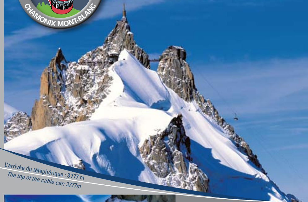
L'arrivée du téléphérique : 3777 m The top of the cable car: 3777m

Accédez à l'Aiguille du Midi par le téléphérique le plus spectaculaire au monde ! Ride up to the Aiguille du Midi in the world's most spectacular cable car!