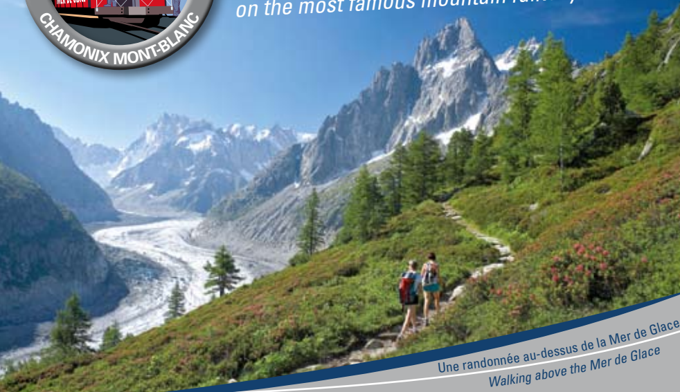
Une randonnée au-dessus de la Mer de Glace Walking above the Mer de Glace

Voyagez à la Mer de Glace avec le plus célèbre train de montagne ! Journey to the Mer de Glace on the most famous mountain railway!