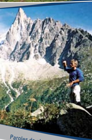
Paroles de glaciologue The glaciologist