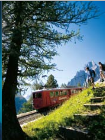
Le célèbre petit train rouge The famous little red train

Un voyage magique de 20 minutes à bord du célèbre train à crémaillère pour atteindre l'un des derniers grands glaciers d'Europe !