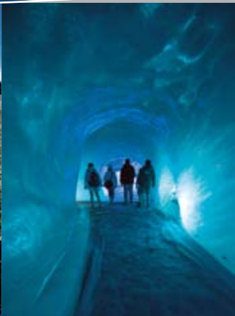
Dans les entrailles du glacier The ice cave