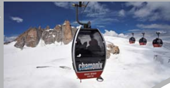
La télécabine Panoramic Mont-Blanc, trait d'union vers la Pointe Helbronner en Italie. The Panoramic Mont-Blanc telecabin, to reach the Helbronner peak in Italy.

from the vantage point of the 4 panoramic terraces, a 360° view over the highest peaks in the French, Swiss and Italian Alps.