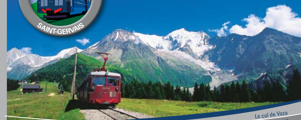
Le col de Voza The Voza pass

Empruntez le train à crémaillère le plus haut de France ! The highest rack railway in France!