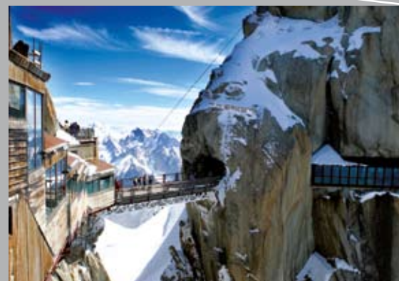
Passer d'un piton à l'autre. The Aiguille du Midi footbridge.

Une excursion en téléphériques pour vivre l'ambiance de la haute montagne, en toute sécurité !