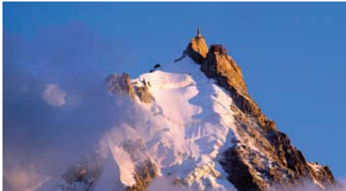
Le site de l'Aiguille du Midi - Il sito della Aiguille du Midi - The site of the Aiguille du Midi

COURMAYEUR BUS (SAVDA - piazzale Monte Bianco 3) Tel. +39 0165 842031 - savda@savda.it - www.savda.it Orari: chiedere informazioni prima della partenza CHAMONIX BUS (SAT - gare SNCF) Tel. +33 (0)4 50 53 01 15 - chamsat@orange.fr - www.sat-montblanc.com Horaires: se renseigner avant le départ.