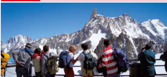
Vue depuis l'Italie - Vista da l'Italia - view from Italy -